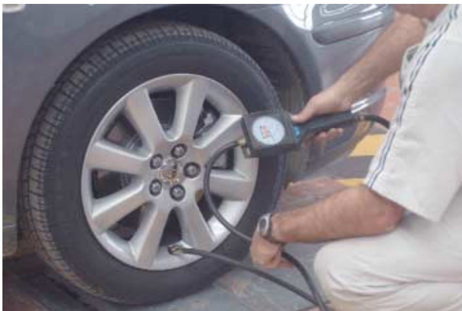
Comprobación de la correcta presión de inflado de los neumáticos.

El accionamiento de cada placa produce una vibración al conjunto de la suspensión de la rueda a comprobar, hasta alcanzar los 25 ciclos por segundo. Una vez alcanzada esa frecuencia, cesa el accionamiento de dicha placa y durante el tiempo que tarda la placa en detenerse, el equipo mide constantemente la carga dinámica de la rueda.