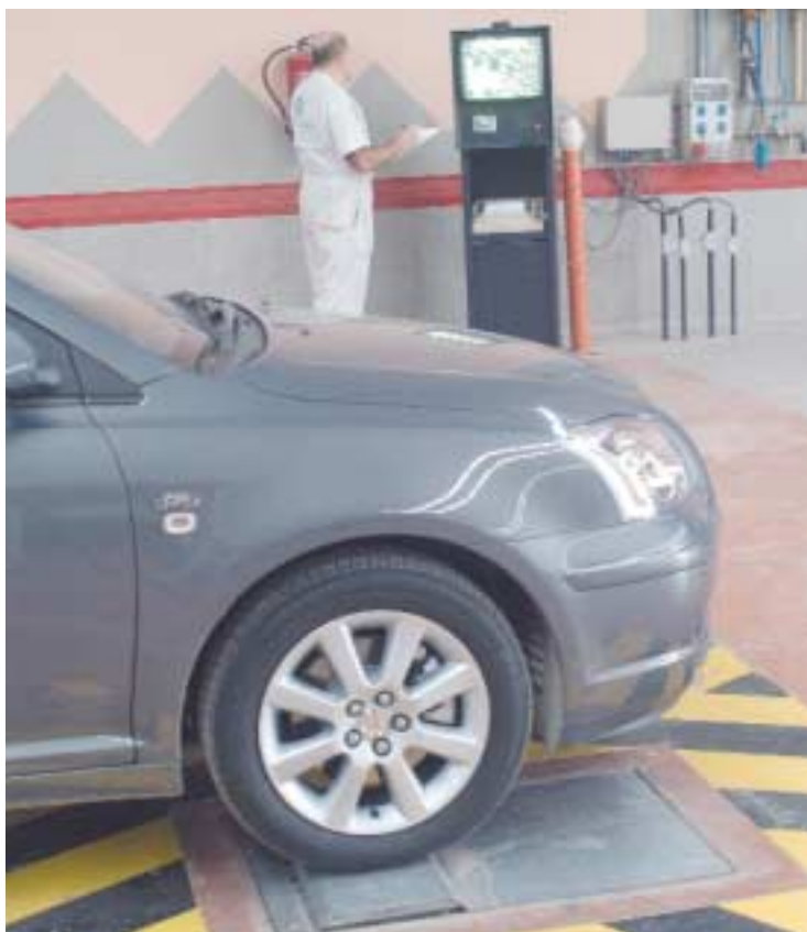
Comprobación de resultados en la diagnosis de la suspensión.

Se puede decir que estos equipos de comprobación de suspensiones equivalen a un simulador de ruta sobre firme irregular, midiendo las fuerzas verticales que la rueda transmite en cada instante a la placa de apoyo, sometida a una vibración cuya gama de frecuencias oscila de 25 ciclos por segundo á 0 durante unos 15 segundos.